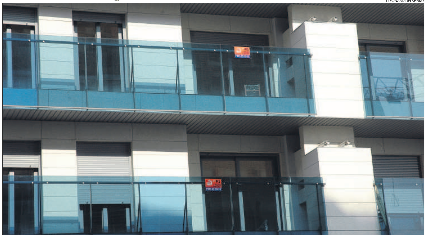
A la capital proliferen els pisos nous desocupats que es posen en lloguer.

més de lloguer. En aquest sentit, va recordar que preveu la creació d'11 àrees residencials estratègiques (ARE) en 10 municipis lleidatans que significaran la construcció de 12.053 nous habitatges, de les quals 6.032 seran de protecció oficial.