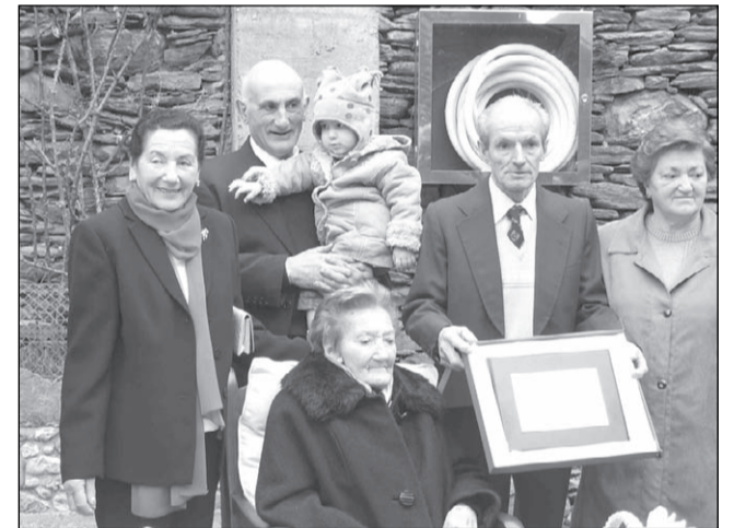
La conmemoración se celebró el día 1 de marzo

■ Quiere que la gente denuncie con imágenes lo que se hace mal y elogie lo bueno del Pirineo