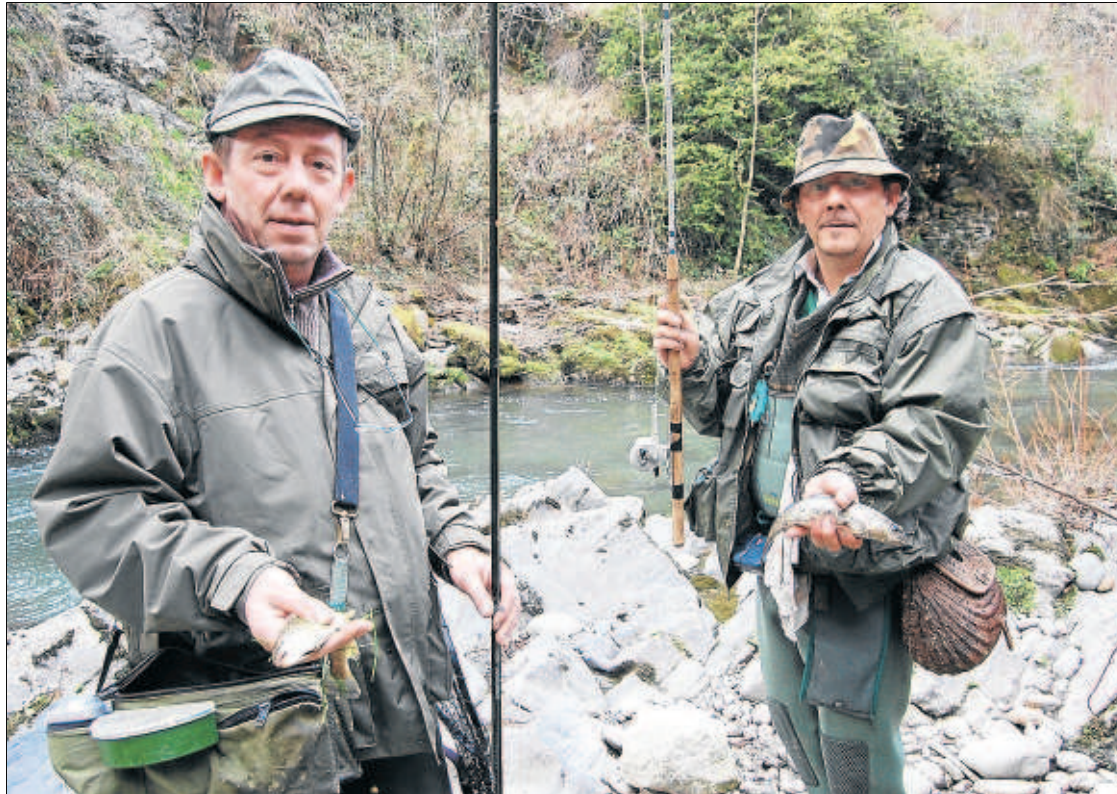
Aquests dos germans francesos es van desplaçar ahir fins a Aran per estrenar la temporada de pesca.

Molts pescadors francesos es van desplaçar fins a algun punt del riu Garona entre Arties i Les en la primera jornada de pesca de baixa muntanya a la Val