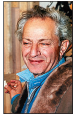
▶▶ El cineasta Jules Dassin.

RETRAT ESCÈNIC // El programa de l'ajuntament inclou, a més, l'espectacle teatral que Carlota Subirós està preparant per a la pròxima edició del Grec. Es tracta d'un retrat reflexiu sobre l'artista que intenta introduir-se en el seu taller mental. Dues exposicions més petites amb fotografies i textos a les biblioteques Francesca Bonnemaison (2 al 16 de maig) i Mercè Rodoreda (20 de maig a 6 de juliol), dos cicles de conferències (un de centrat en la guerra civil), una taula rodona emmarcada en el certamen Barcelona Poesia i un club de lectura que intenta seguir-la com a lectora completen la proposta. ≡