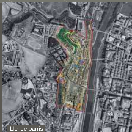
Llei de barris