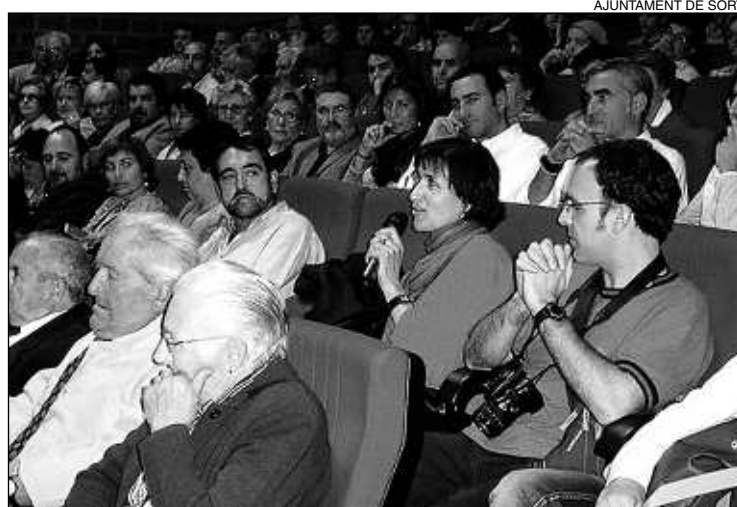
Assistents a la presentació del llibre.

origen i evolució d'un cognom pallarès', descobreix les arrels d'aquest cognom que ha estat molt vinculat a la història del Pallars. L'origen es troba a l'Edat Mitja-