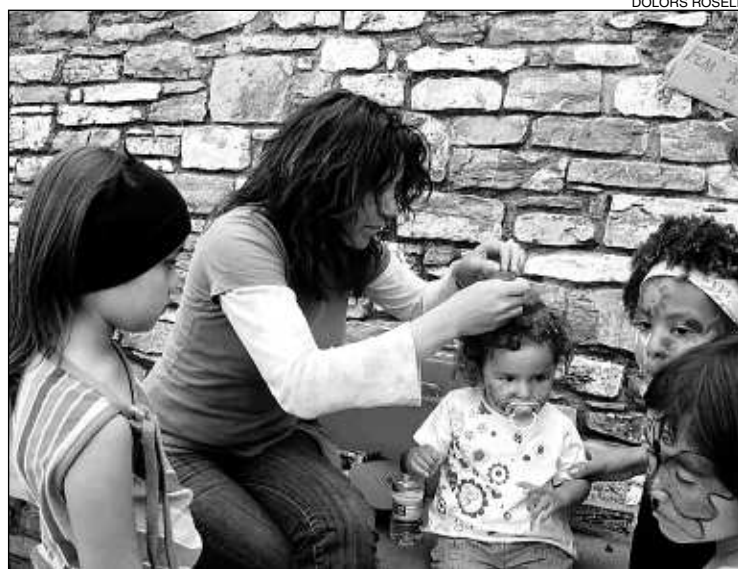
A la fira hi va haver un taller de maquillatge i trenes pel cabell.