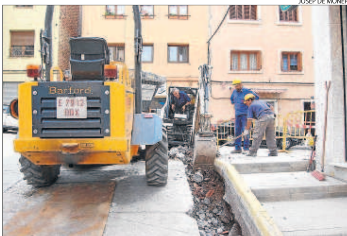
Les obres al carrer Monestir Lavaix del Pont de Suert.