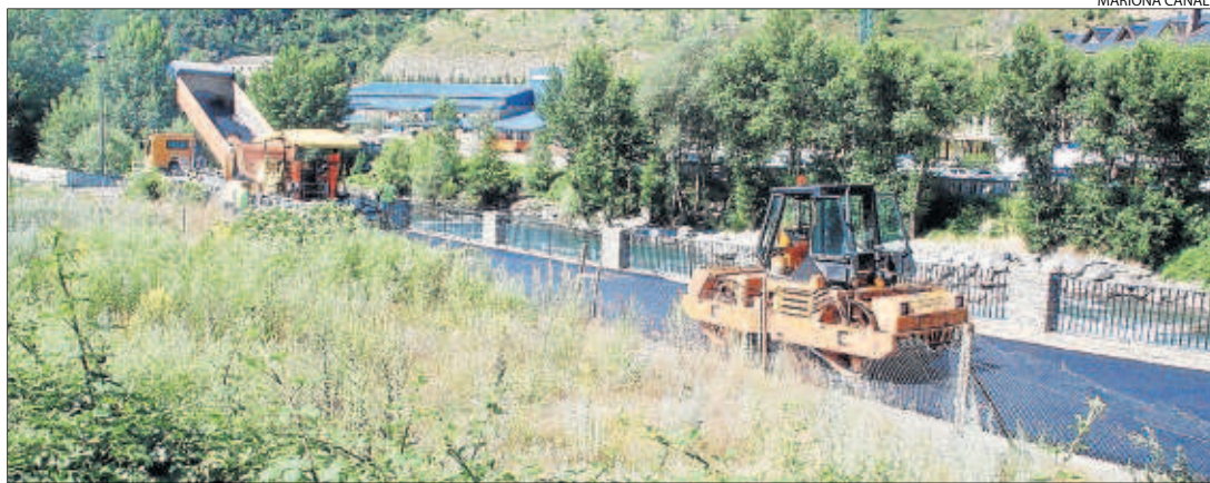
Imatge de les obres portades a terme a la carretera que surt de la Nacional a Sort, al costat del riu.